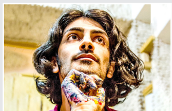
امین شریفی آهنگساز ایرانی که رویای معرفی موزیسین‌های ایران در سطح بین‌المللی را در سر دارد.

می خواستیم به با استعدادها فرصتی داده شود